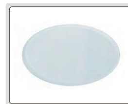
磨砂玻璃滤光片(标配)